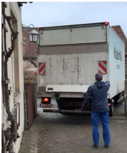
Ankunft in Wiesenbronn