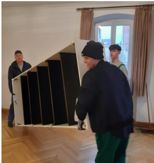
Das letzte Regal wird verladen.