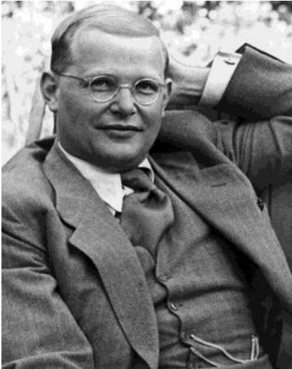
Dietrich Bonhoeffer (1906–1945) in London, März 1939.

Der Theologe Dietrich Bonhoeffer schloss sich im Kirchenkampf der Bekennenden Kirche an und übernahm für sie 1935 die Ausbildung der angehenden Pfarrer im Predigerseminar Finkenwalde. Hier entwickelte er Leitlinien für ein gemeinsames Leben. Mit seiner Forderung, dass die Pfarrämter keine Ariernachweise herausgeben sollen, setzte er sich nicht durch. Bekannt ist sein Ausspruch: "Wer nicht für die Juden schreit, darf auch nicht gregorianisch singen" , d.h. der darf auch nicht Gottesdienst feiern.