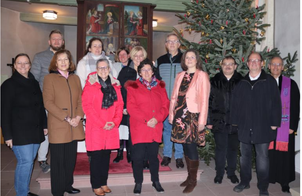
Verabschiedung des alten und Einführung des neuen Kirchenvorstands Abtswind

Zur Bundestagswahl 2025 machen die christlichen Kirchen ihre Stimme sichtbar: Unter dem Motto „Für alle. Mit Herz und Verstand“ rufen sie die Bevölkerung auf, durch aktive Teilnahme an den Wahlen die Demokratie zu stärken und extremistischen Positionen entgegenzuwirken. In den Mittelpunkt rücken sie dabei die christlichen und gesellschaftlichen Werte wie „Menschenwürde“, „Nächstenliebe“ und „Zusammenhalt“. Landesbischof Christian Kopp betont: „Politisch und gesellschaftlich stehen wir vor der großen Aufgabe, viele Lebensbereiche zukunftsorientiert zu gestalten: Zuwanderung, Integration, Sicherheit, Klimawandel, Wirtschaftswandel und soziale Gerechtigkeit. Sie erfordern eine offene und intensive Auseinandersetzung. Gerade demokratische Strukturen bieten die besten Voraussetzungen, um für alle zukunftsfähige Antworten zu finden.“