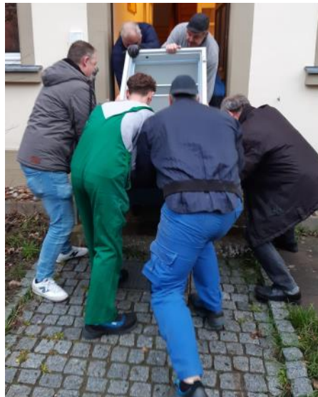
Auch der Tresor geht mit.