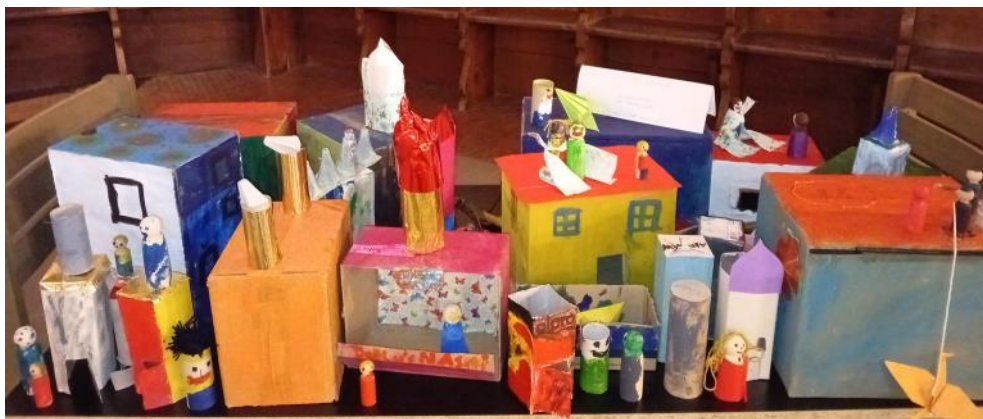
Kinder gestalteten das himmlische Jerusalem beim Kinderbibeltag