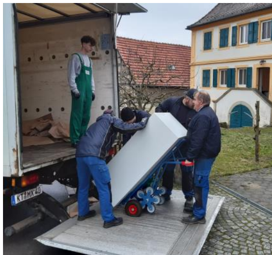
Das schwerste Stück wird ausgeladen.

Der Umzug verlief reibungslos. An dieser Stelle danken wir Kräuter Mix und den beteiligten Arbeitern ganz herzlich für die großzügige Unterstützung beim Umzug. In drei Stunden war alles an seinem neuen Platz.