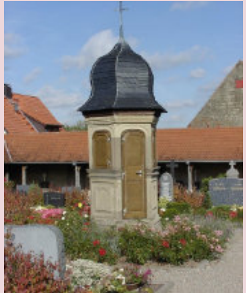
Auferstehungsfeier am Ostersonntag auf dem Friedhof