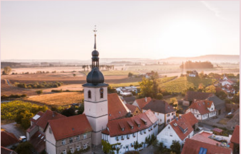
Blick auf die Kirchenburg