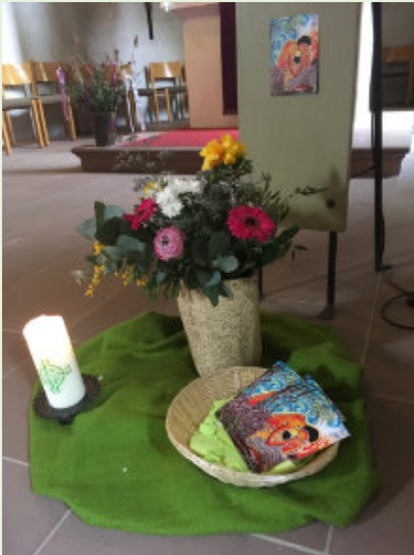
Weltgebetstag analog in der Kirche und digital als Zoom-Gottesdienst

Es ist ein lang gehegter Wunsch: ein Gebetsleuchter für die Kirche, damit Besucherinnen und Besucher ihren Gebetsanliegen sichtbar Ausdruck verleihen können. Gerade