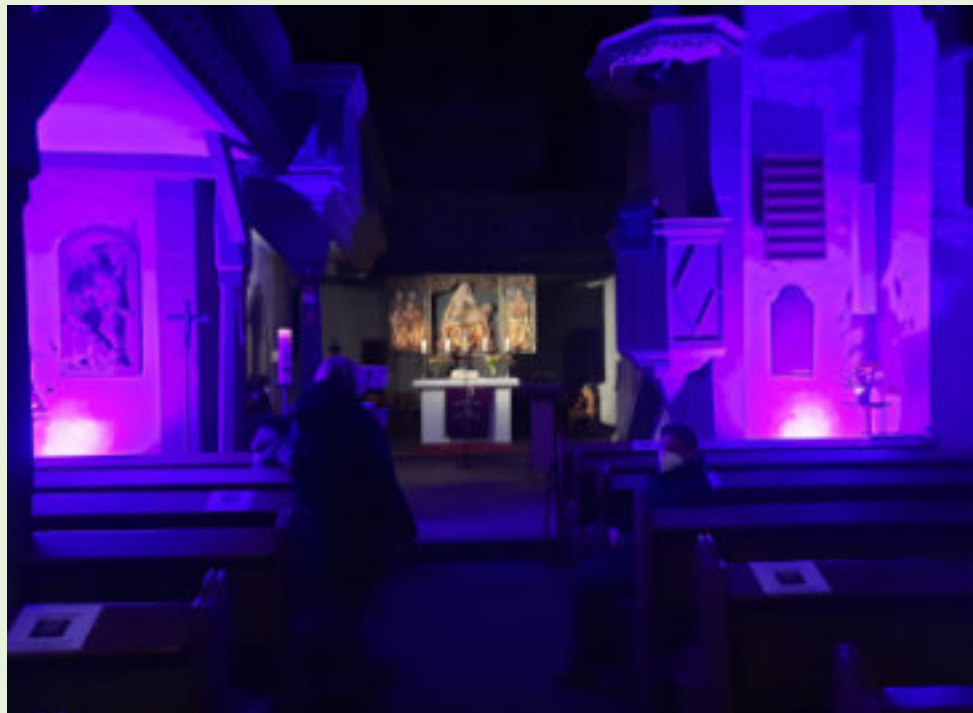
Meditative Stimmung bei der Abendandacht am 27. Februar