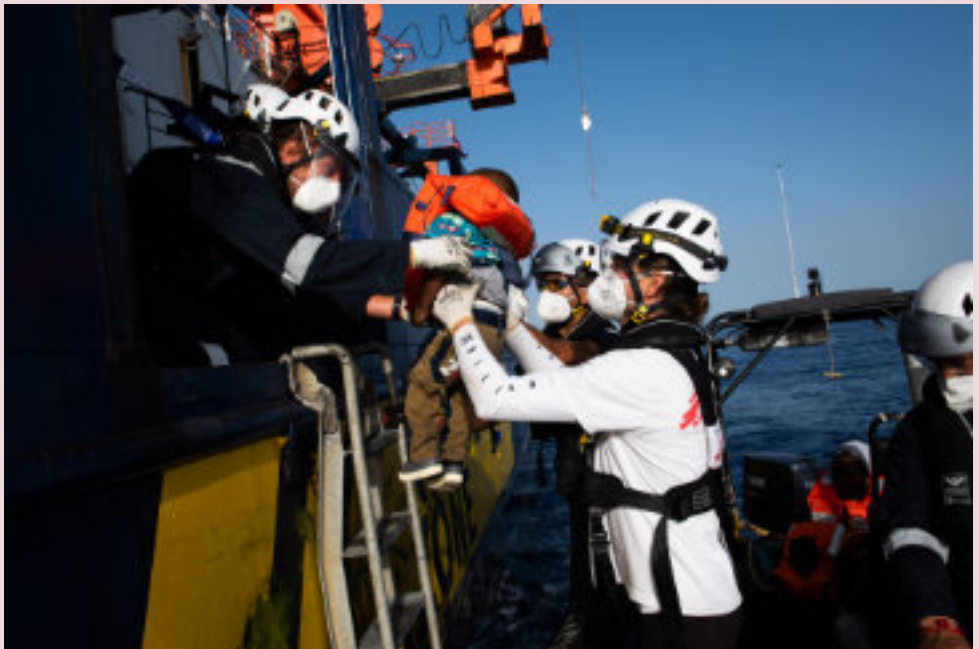
Die Sea-Watch 4 bei ihrem ersten Einsatz im August 2020

Wir schicken ein Schiff Filmabend und Diskussion Freitag, 11. Juni 2021, 20 Uhr in der Heilig Kreuz-Kirche