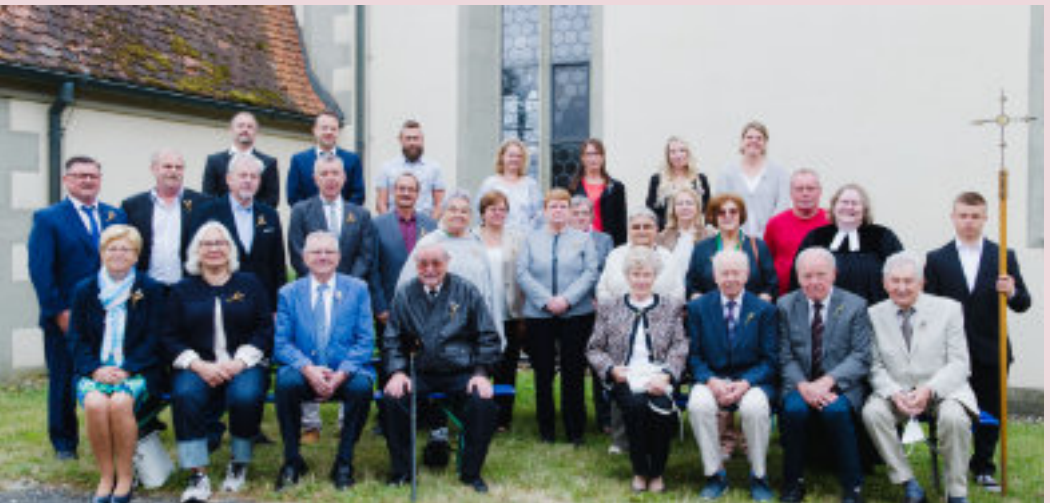
Die erste Jubelkonfirmation