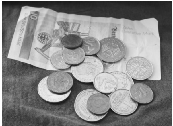
Die D-Mark hat ihren Wert behalten.

Tauchen auch bei Ihnen manchmal noch unvermutet alte D-Mark-Münzen auf? Wir freuen uns, wenn Sie dieses Geld für die Renovierung unseres neuen Gemeindehauses spenden! Sie können die Münzen einfach im Pfarramt abgeben oder in die Kollektenbüchse einlegen. Handelt es sich um einen größeren Betrag, dann stellen wir Ihnen natürlich gerne eine Spendenquittung aus. Bitte geben Sie dafür dann Ihren Namen und Ihre Adresse mit an.